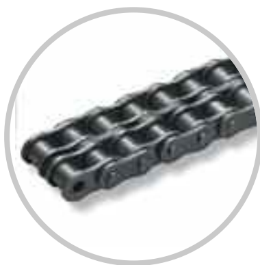
Chaînes à rangées multiples