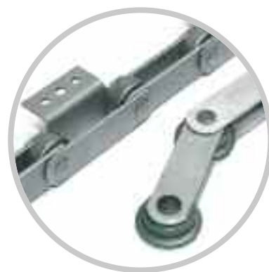
Chaînes de manutention