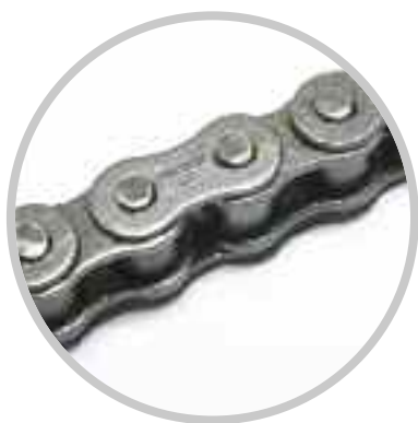
Chaînes de transmission