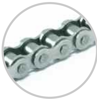
Chaînes en acier inoxydable